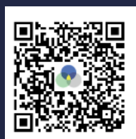
テクノアークホームページ

平日の9～16時開始で、希望の日程への調整も可能です。 お気軽にご相談ください★