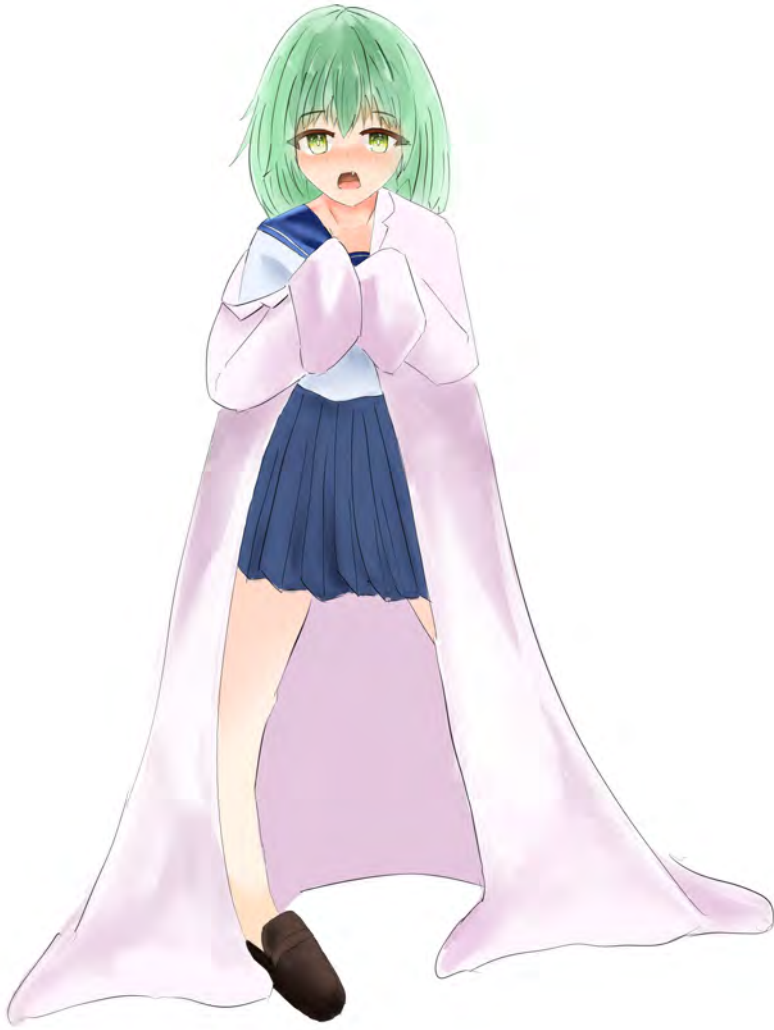
ライトノベルを想定した主人公 (左上) パートナー (右下)

制作時期 2022/05 制作時間 30 時間 使用ツール Clip Studio