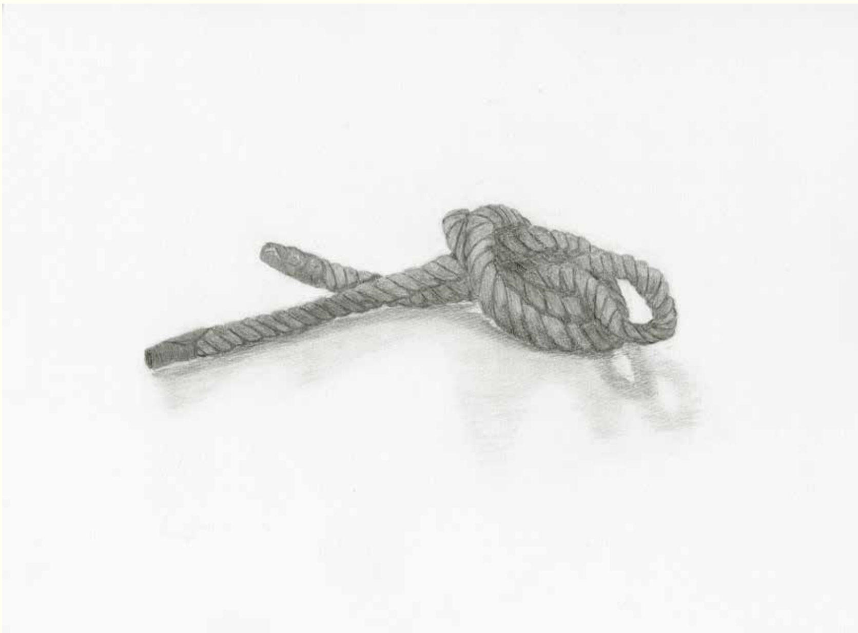
縄 制作時間：約6時間 画材：鉛筆、消しゴム、ねりけし、B4 画用紙