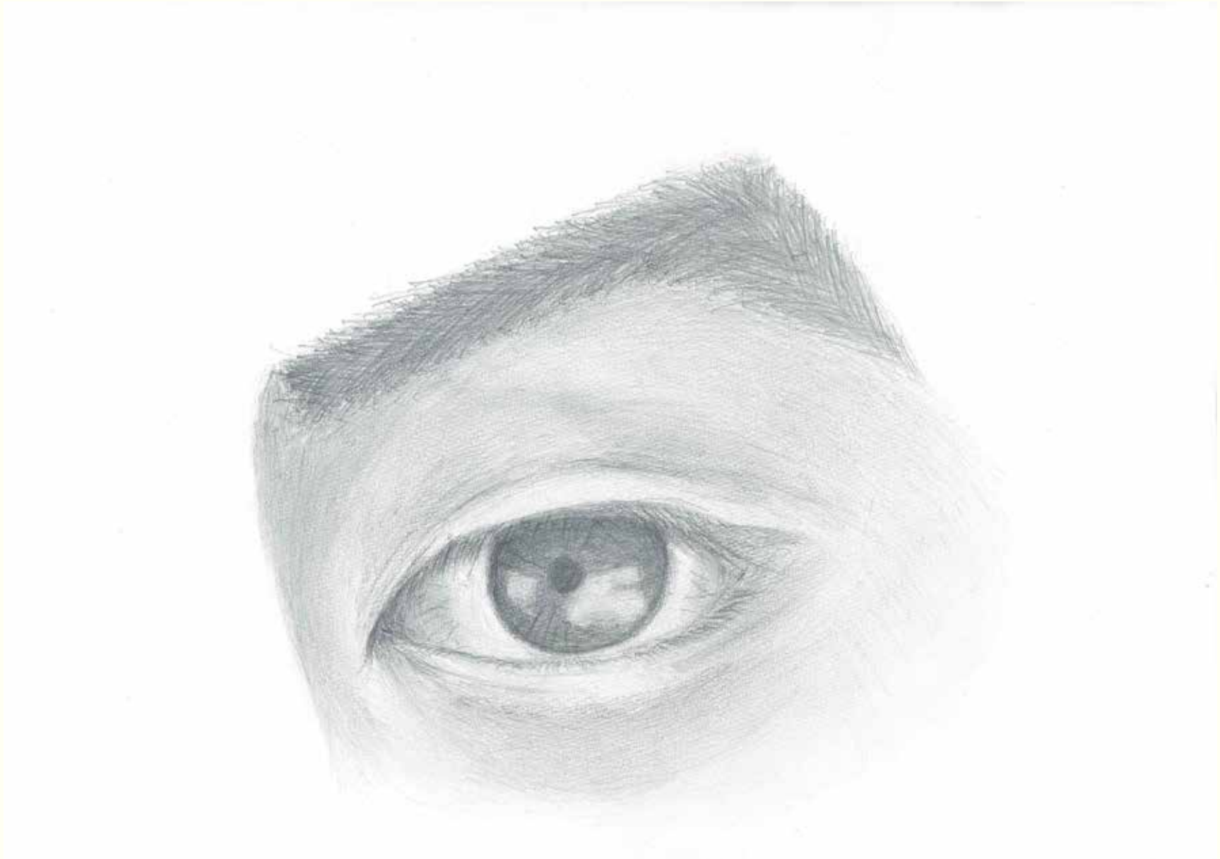
目 制作時間：約 10 時間 画材：鉛筆、消しゴム、ねりけし、B4 画用紙