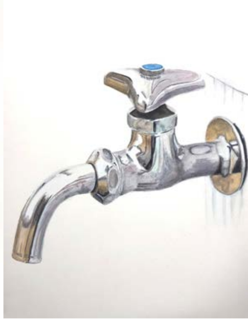
制作時期 2021年 制作時間 9時間 使用画材 アクリルガッシュ