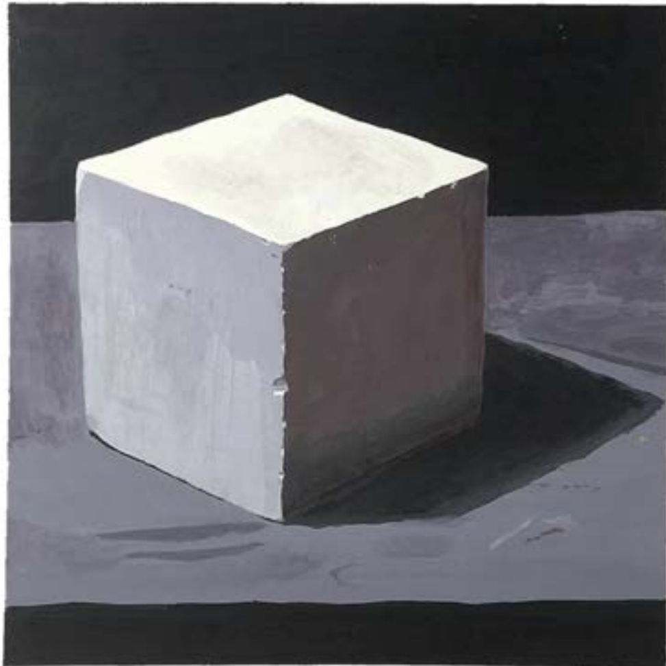
制作時期 2021年 制作時間 9時間 使用画材 アクリルガッシュ