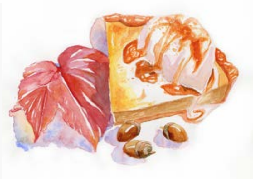
制作時期 2021年 制作時間 9時間 使用画材 水彩絵具