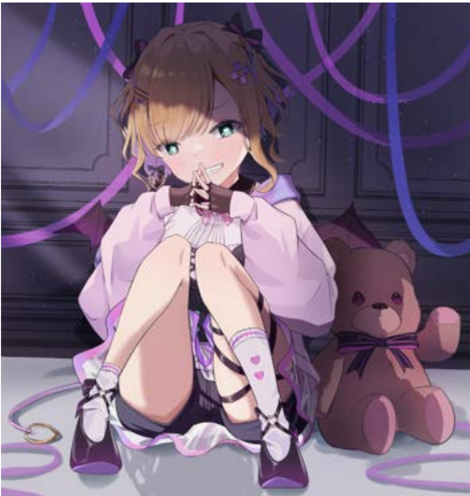
ふいすぼ 胡桃のあ