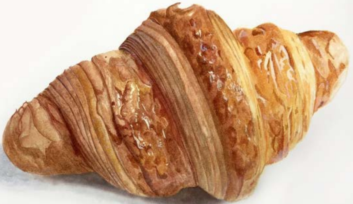
制作時期 2021年 制作時間 18時間 使用画材 アクリルリキテックス