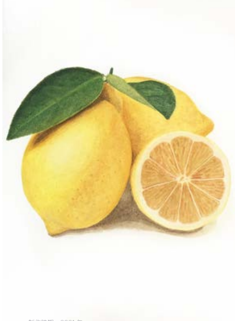
制作時期 2021年 制作時間 9時間 使用画材 アクリルリキテックス