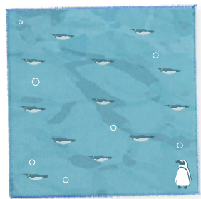
中身のハンドタオル