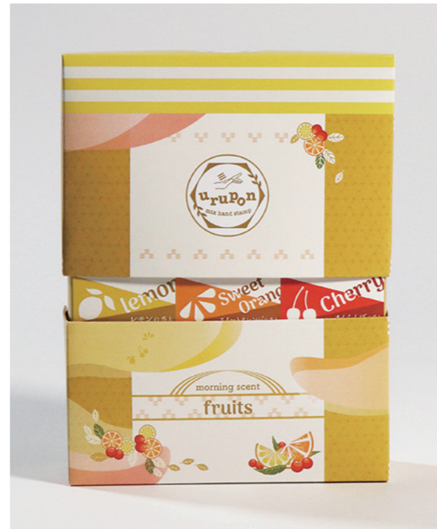
朝の香り フルーツ