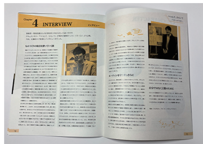
映画パンフレット、DVD ジャケット