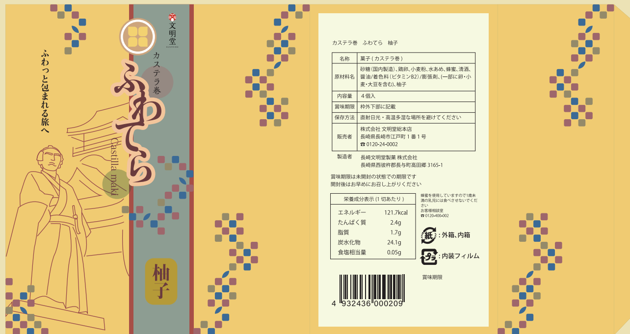
坂本龍馬像と高知城の景色のパッケージ