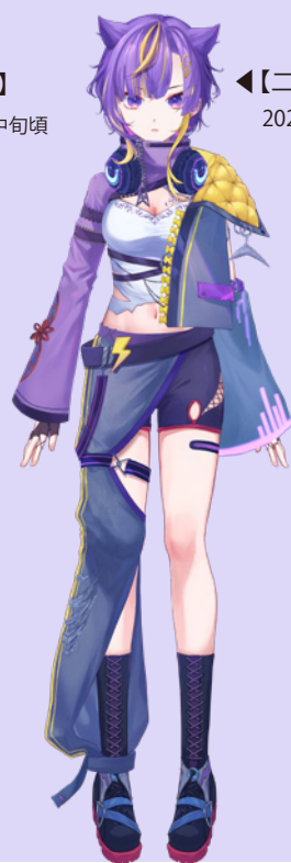
◀【二次審査】 2023/10 月頃