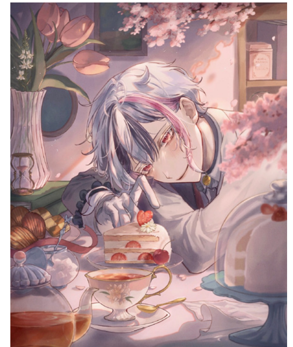
制作期間：2023/2/30 - 2023/3/4(25 時間)