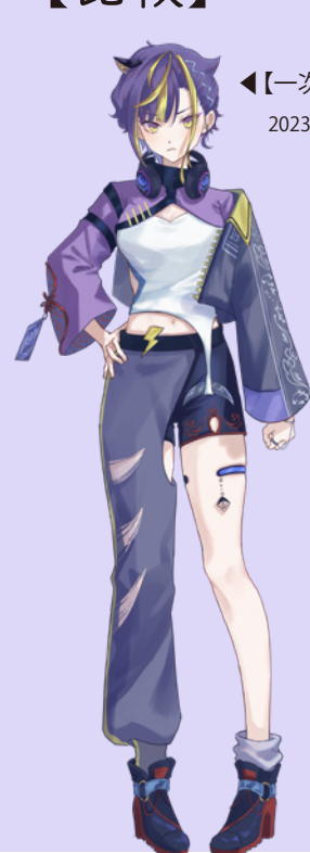
◀【一次審査】 2023 / 5 月中旬頃