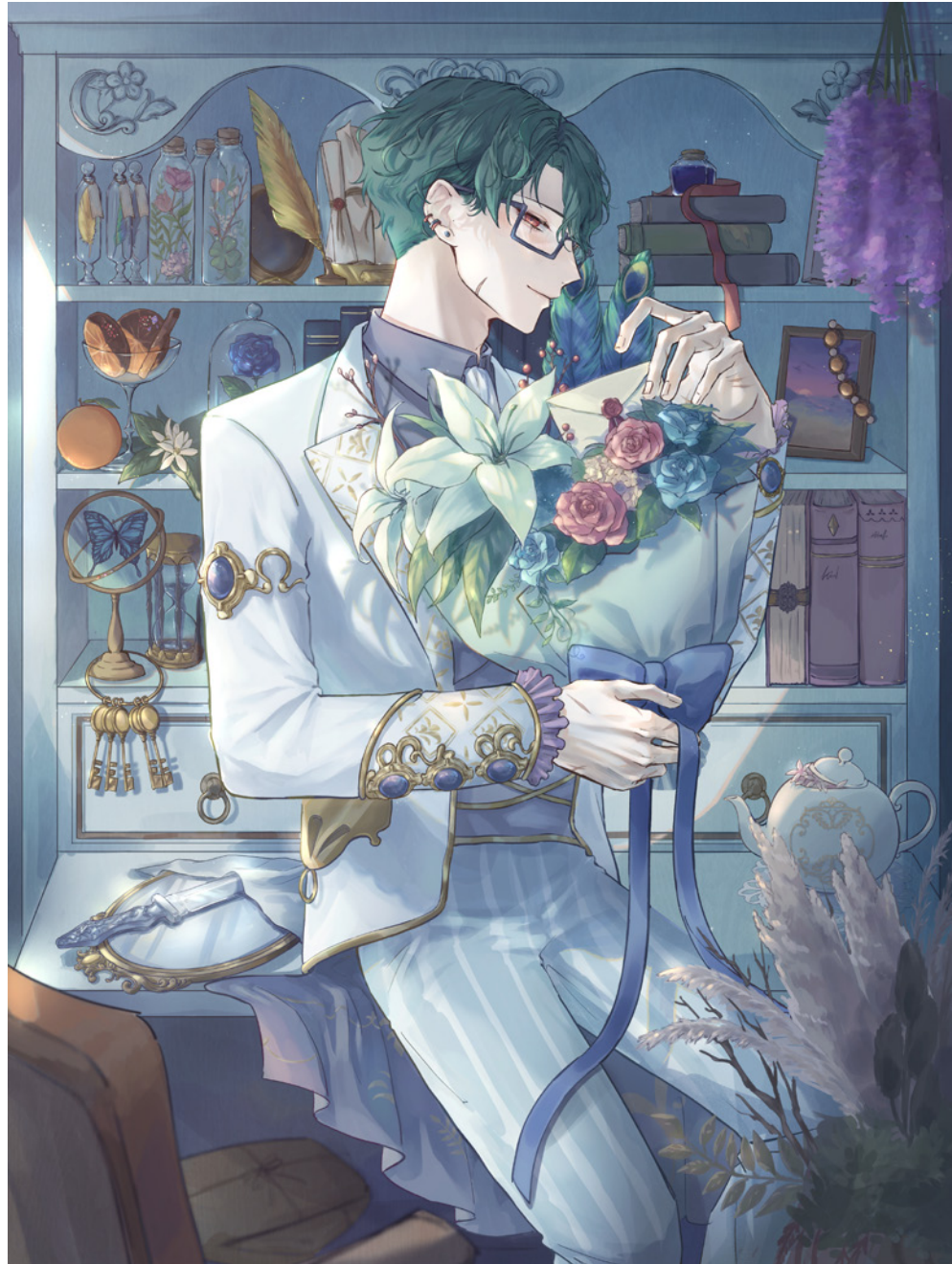
制作期間：2023/1/30 - 2/6 (30 時間)