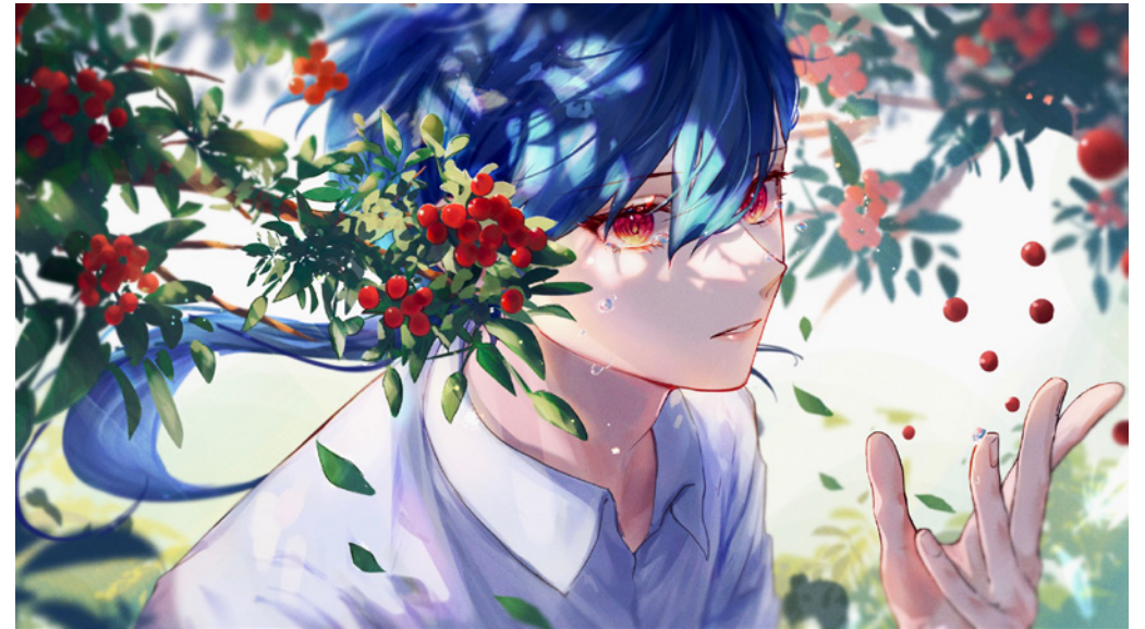
制作期間：2023/12/1 - 2023/12/8(20 時間)