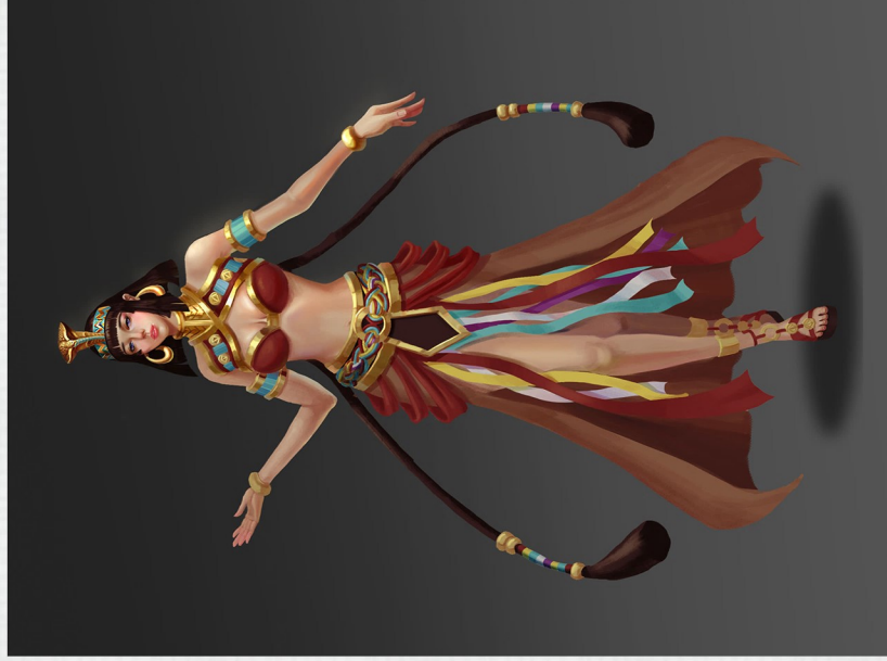
タイトル 《エジプト女王》