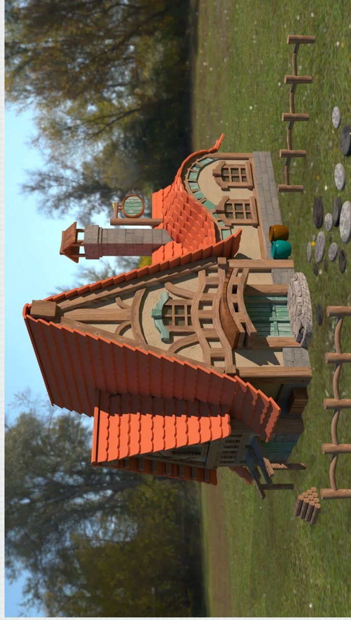
タイトル 《ログハウス》