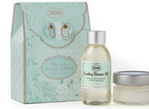
ミニボディケアキット