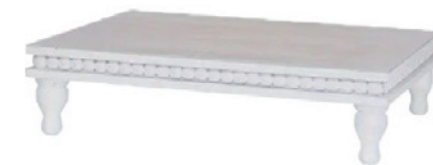
幅 400mm × 奥行き 300mm × 高さ 100mm