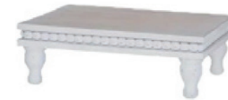
幅 300mm × 奥行き約 224mm × 高さ約 97mm