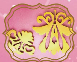
工具のシルエット