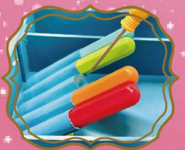
取り出しやすい ドライバーホルダー