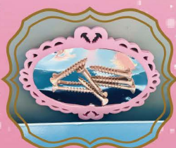
鏡モチーフの ねじ置き