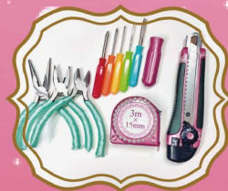
こだわり デザインの工具