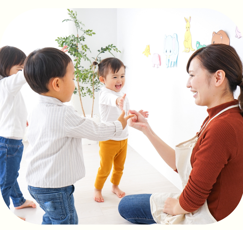
子どもの伸びる芽を培う

文部科学省の教育要領に基づいて幼児を保育し、 適切な環境を与え、 その心身の発達を助長し、 健康で社会性に富み、 たくましく心豊かな幼児の育成に努めます。