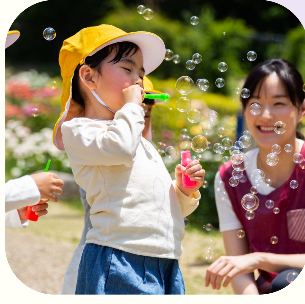
子どもの主体性を育てる