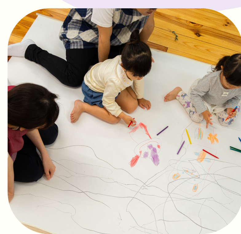
目を離さない指導を徹底する