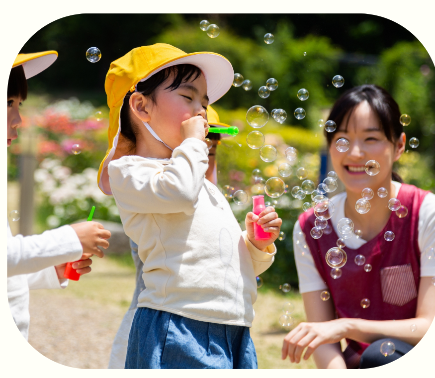
子どもの主体性を育てる