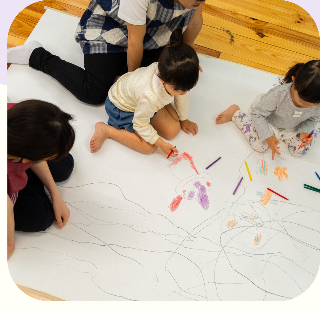
目を離さない指導を徹底する