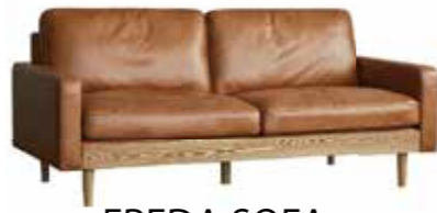
FREDA SOFA ¥152,900 サイズ 素材 幅179cm フレーム:アッシュ材(オイル仕上) 奥行88cm 張地:レザーテックス 高さ78cm 中材:フェザー スピニングスポンジ ウレタンフォーム、Sバネ