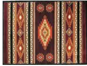
RUG ¥52,800 サイズ 素材 幅230cm オレフィン100% 奥行160cm