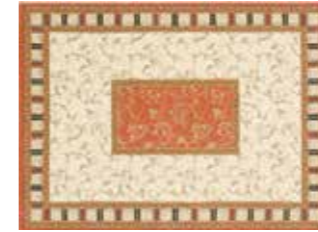
RUG ¥108,000 サイズ 素材 幅340cm ポリプロピレン100% 奥行240cm ヒートセット