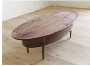
LEGARE Oval Table ¥107,800 サイズ 素材 幅105~120cm ウォールナット無垢材 奥行55cm オーク無垢材(オイル仕上) 高さ35cm