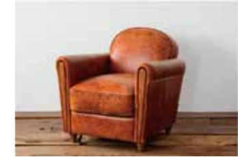
OAKS CLUB CHAIR ¥165,000 サイズ 素材 幅76.5cm オイルレザー、オーク材 奥行77.5cm 高さ75cm 座面高:38cm