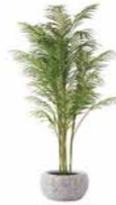
PALM ¥55,000 サイズ 幅80cm 奥行80cm 高さ150cm