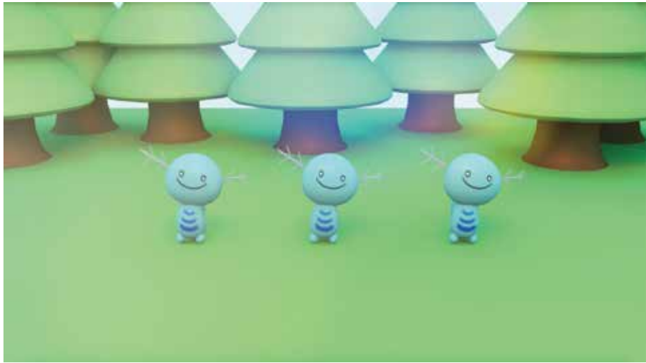
ウパーアニメーション (2024) (Zbrush,Cinema4D ~3days)