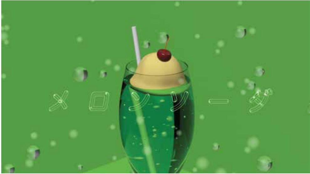
メロンソーダ (2023) (Cinema4D ~7hrs)