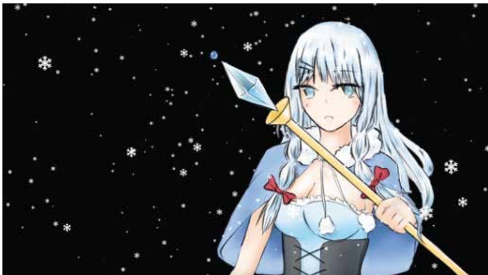
魔法使い、(2023) (Clip Studio Paint,After Effects ~3days)