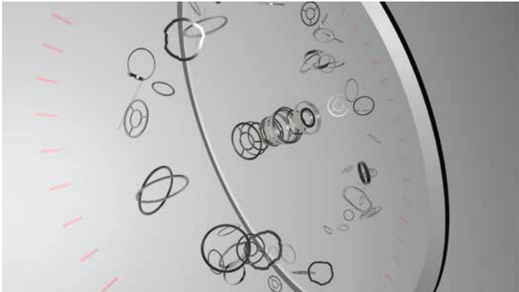
beatmania IIDX BGA 再現 (2024) (Cinema4D ~5days)