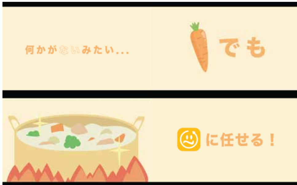
架空アプリのCM (2023) (Illustrator,After Effects ~4days)