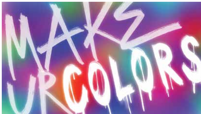
Lettering Design (2023) Procreate ~3hrs