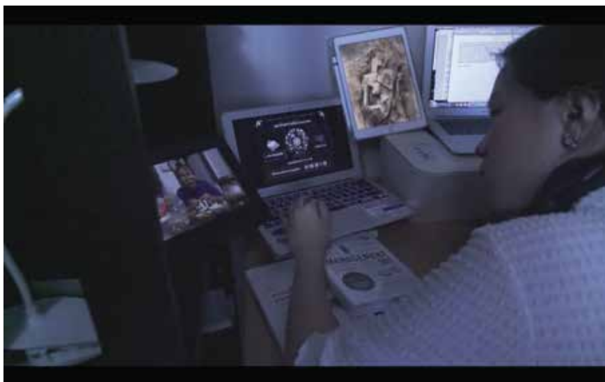
Funeral Gone (2019) カメラ、編集、カラーリング (Premiere Pro ~4hrs)