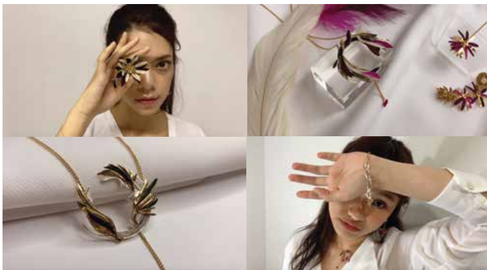
WITHI - Invaluable Intellect of WITHI (2021) カメラ、編集、カラーリング (Final Cut Pro ~3hrs)