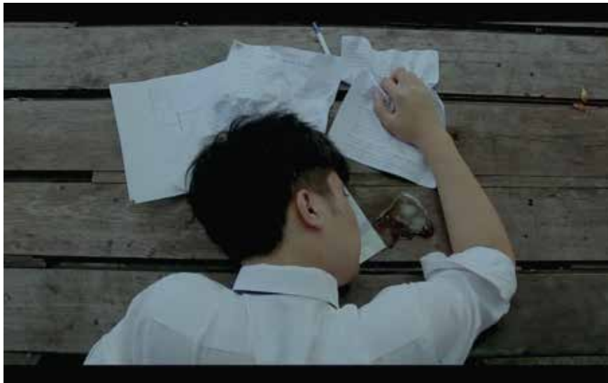
University Mystery Story (2017) 原作、カメラ、編集、カラーリング (Premiere Pro ~2hrs)