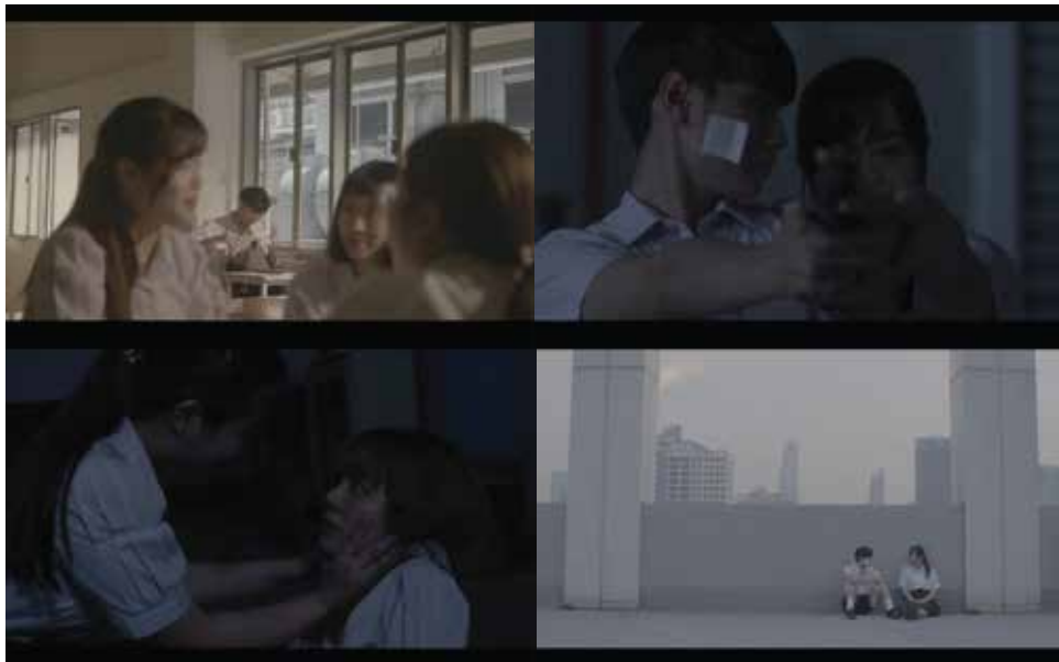
Murderer's Loveletter (2020) 原作、監督、編集、カラーリング (Premiere Pro ~7hrs)