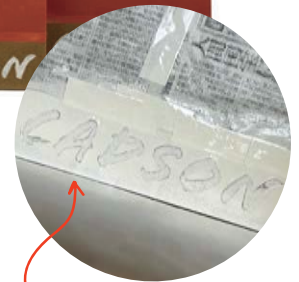
Stencil & Spray