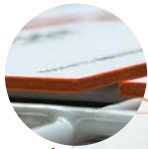
Press & Pull