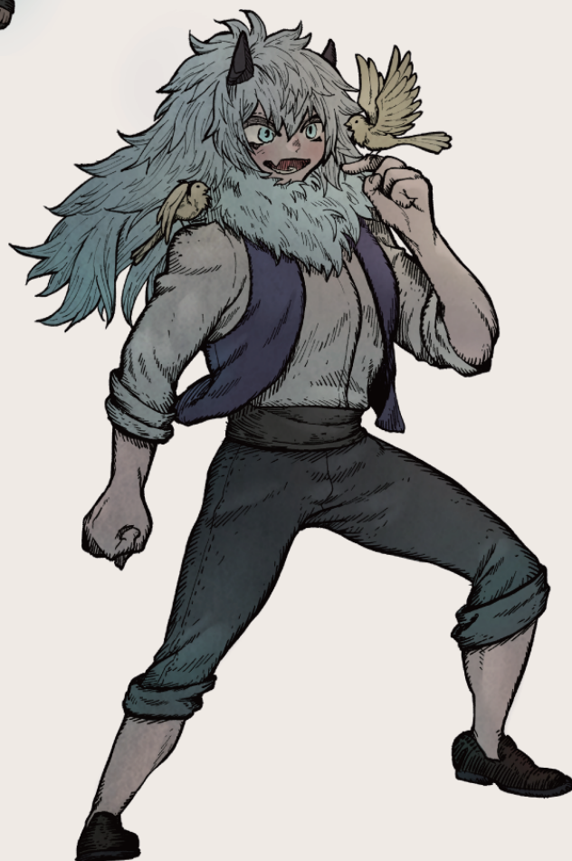
キャラクターイラスト