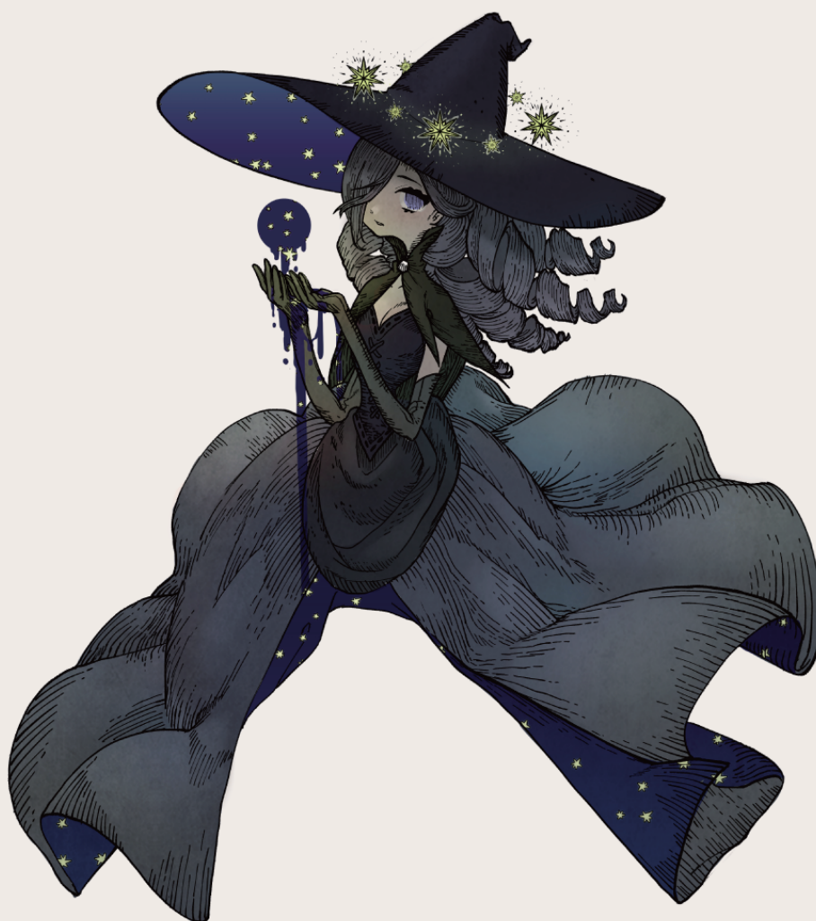
キャラクターイラスト