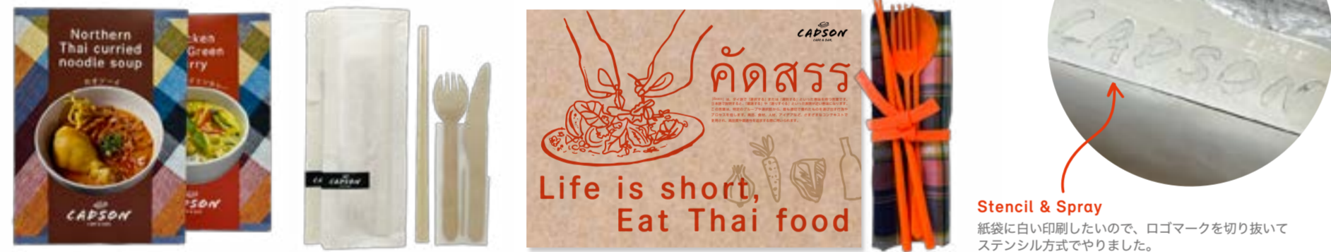
Stencil & Spray 紙袋に白い印刷したいので、ロゴマークを切り抜いてステンシル方式でやりました。