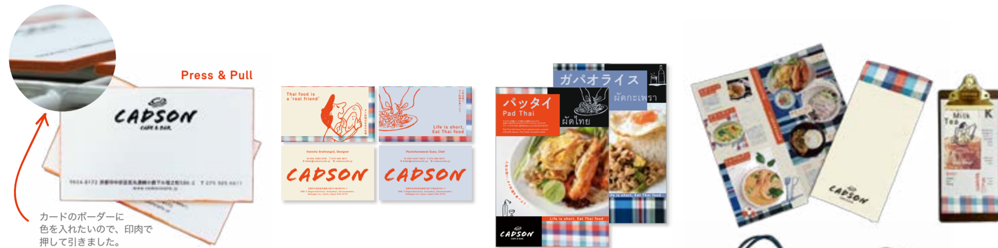
カードのボーダーに色を入れたいため、印肉で押し引きました。