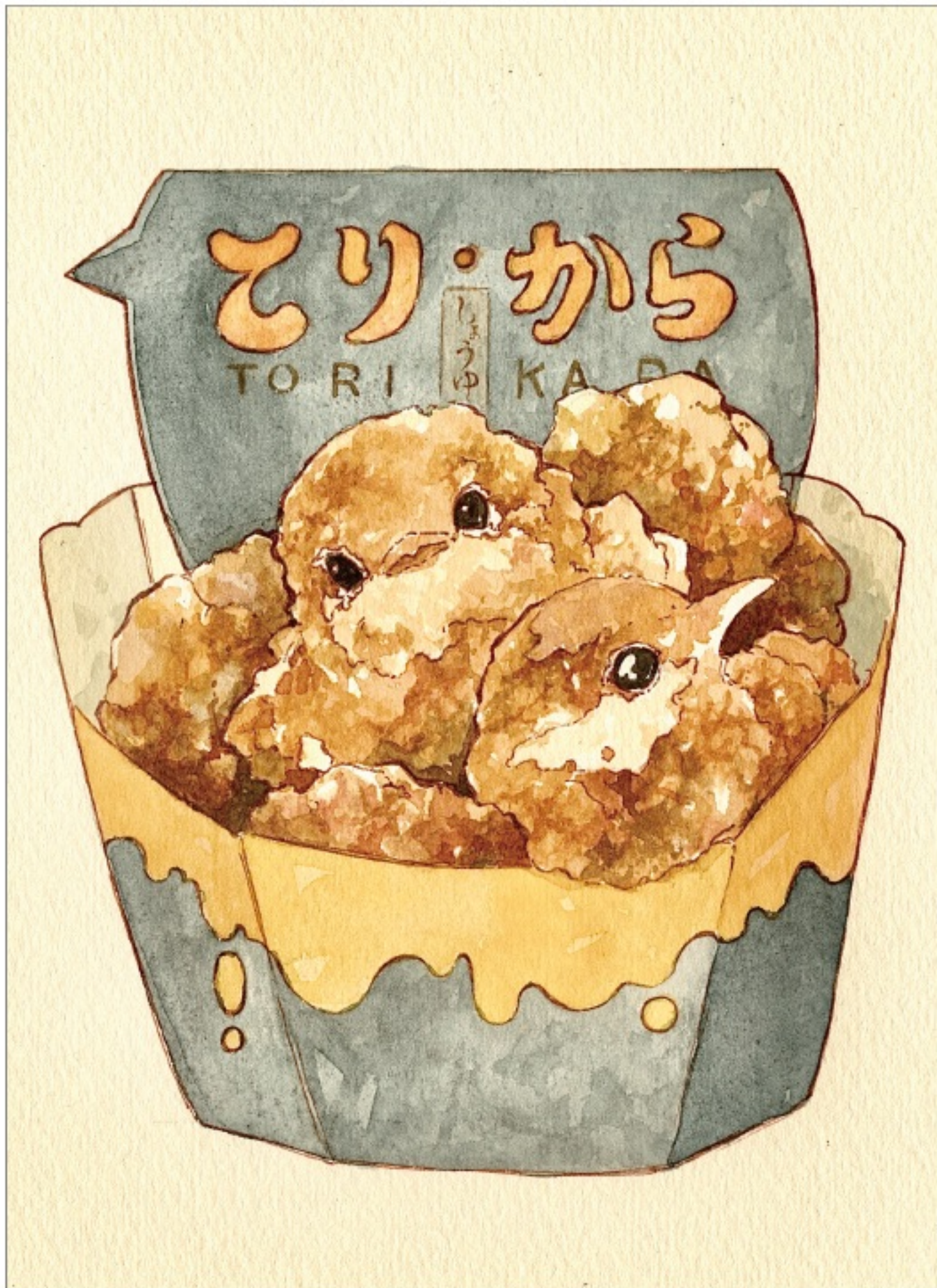
タイトル：「トリ唐揚げ」 制作時間：9時間

作品説明：コンビニのホットスナックコーナーに可愛らしい生き物がいたら... というテーマです。