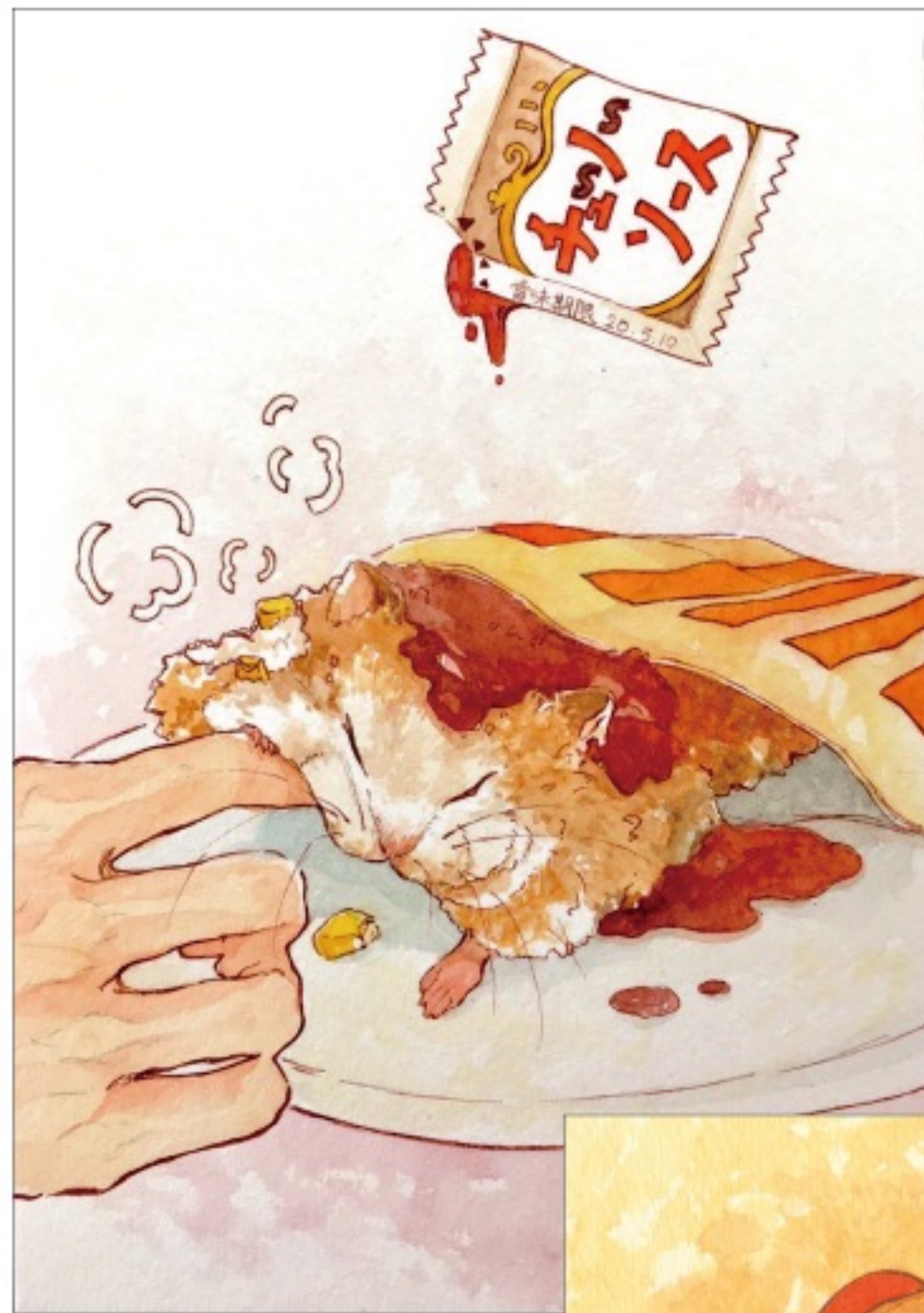
タイトル：「ハムなコーンクリームコロッケ」 制作時間：7時間

作品説明：コンビニのホットスナックコーナーに可愛らしい生き物がいたら... というテーマです。