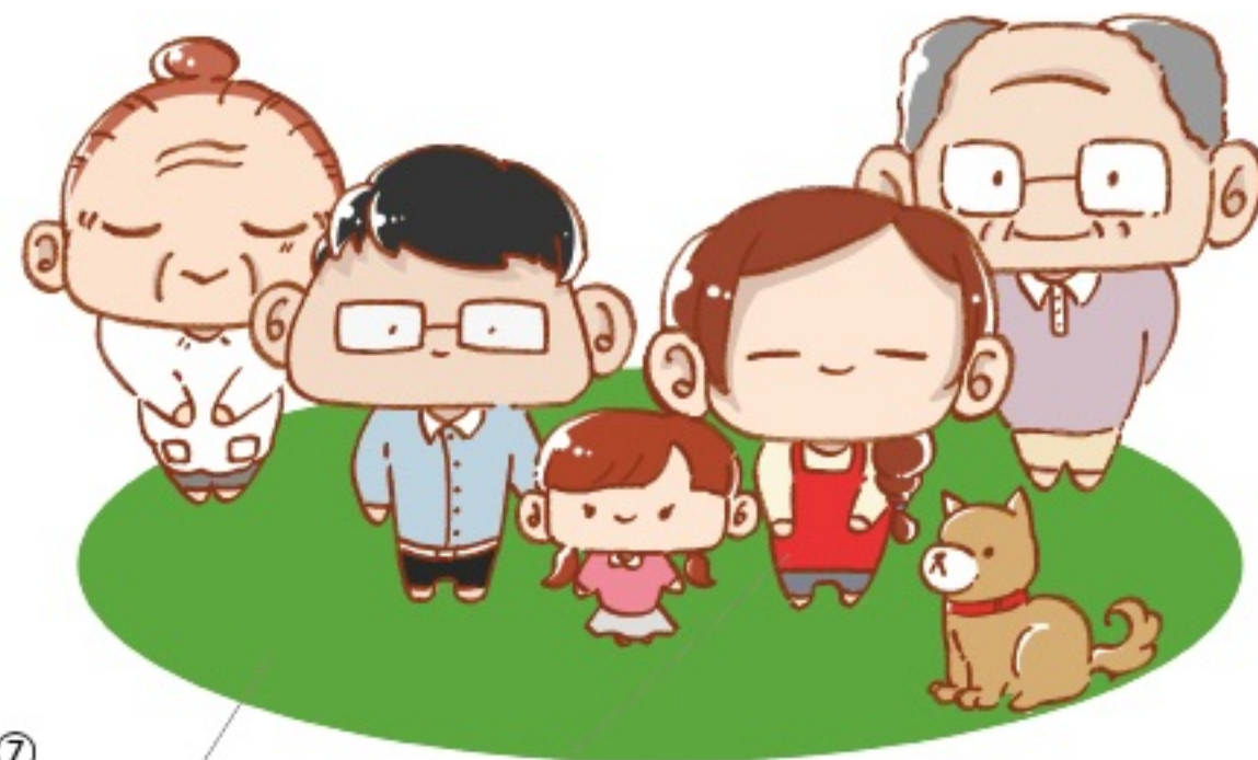
⑦家族イラスト ：二世帯家族+ペット