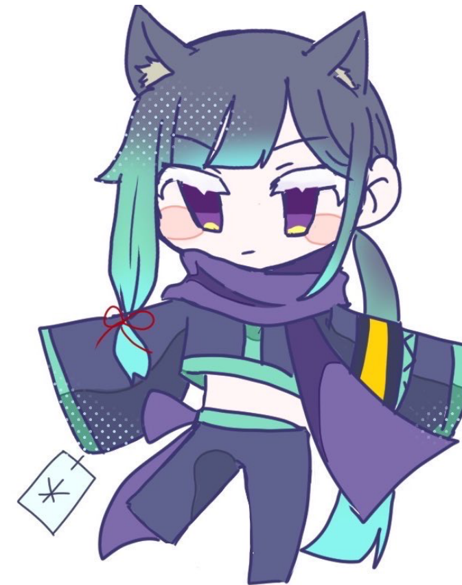
「デフォルメイラスト」