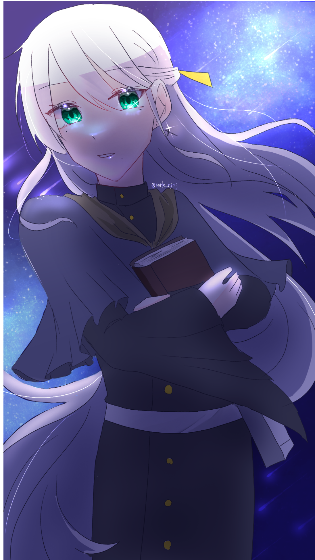
「神の声を聞くもの」