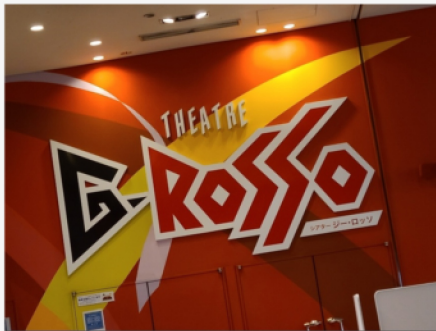
↑ ヒーローショーの聖地