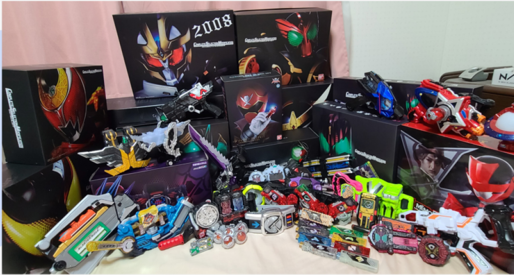
↑ 集めている玩具の一部