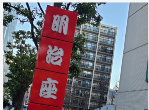
↑ 友達と観劇しに行った舞台