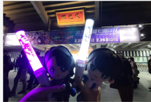
↑ ライダー、戦隊のイベント