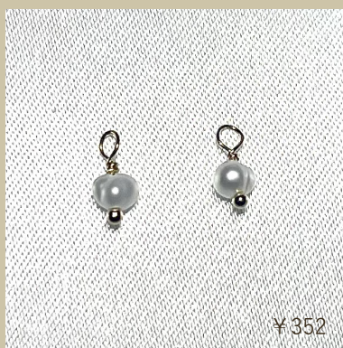
めがね留め フリンジチャーム 淡水パール