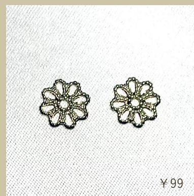
スカシパーツ 花八弁