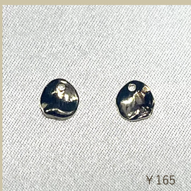
チャームポタニカル 花びら