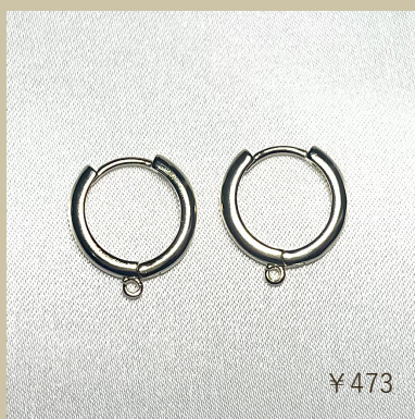
デザインピアスフープ ラウンドカン付き