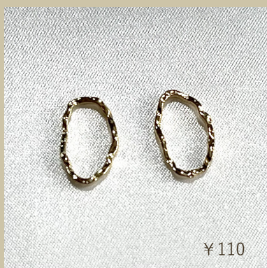
メタルフープ 変形オーベル PT-304740-G5