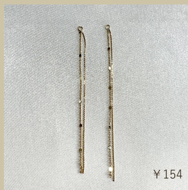
デザインチェーンチャーム PC-303261-G5