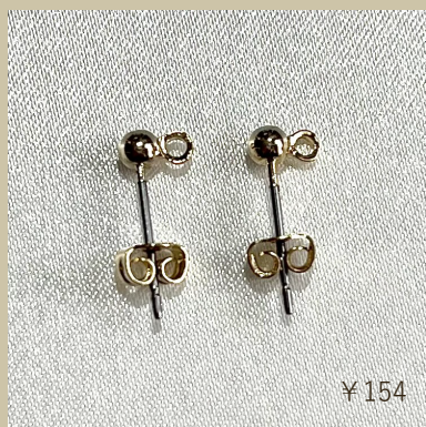
ピアス 3mm丸玉縦カン付き PC-303261-G5