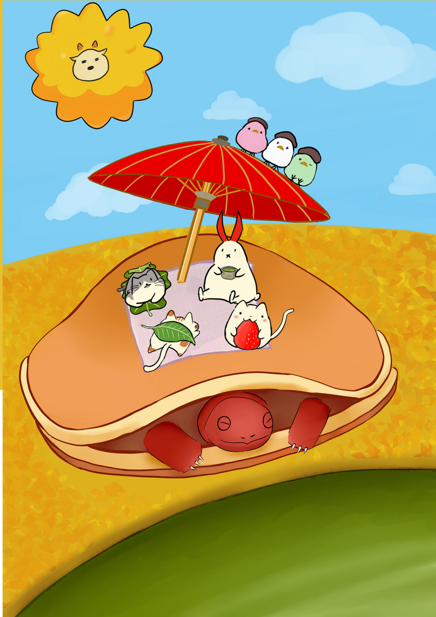
イラスト 「和菓子どうぶつ」