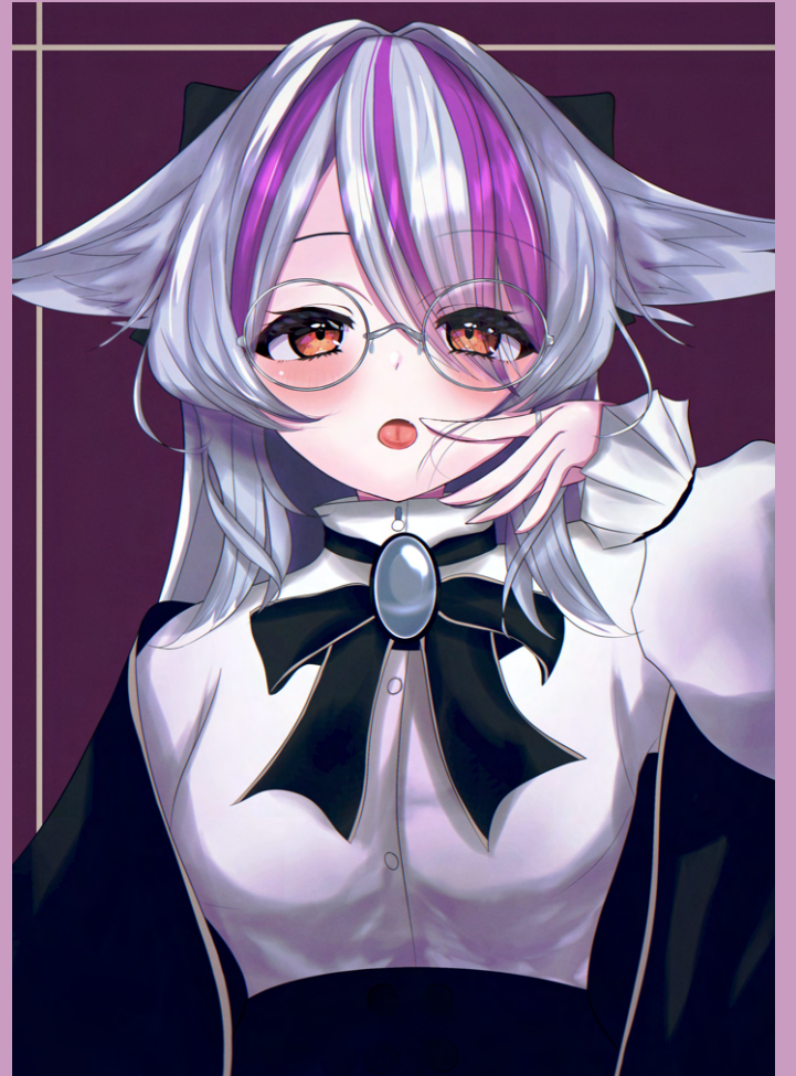
▲『ComicVket3』にて、発売する同人誌の3Dモデルアバターのイラスト。