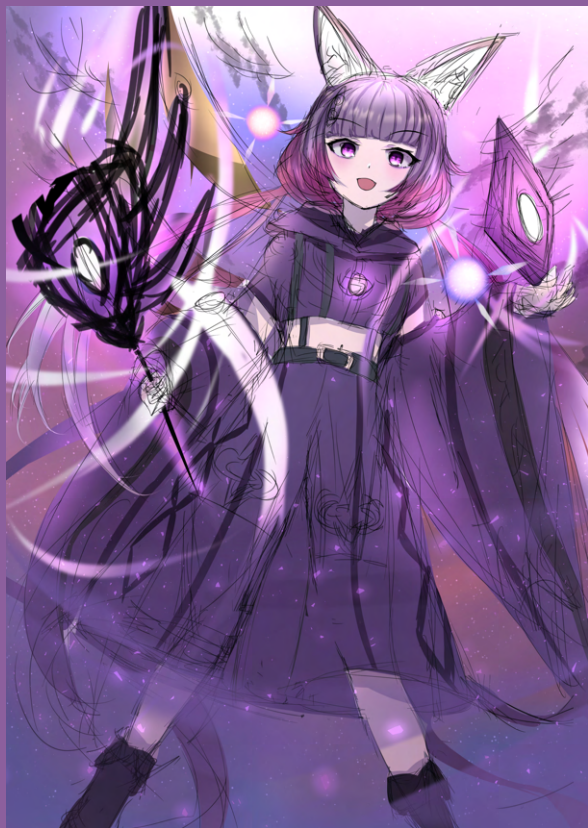
▲ 色ラフ 2、服の色を変えました。