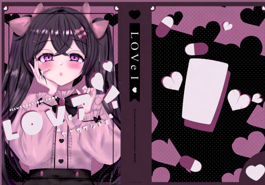
▲ BOOK デザインの課題に制作したブックカバー