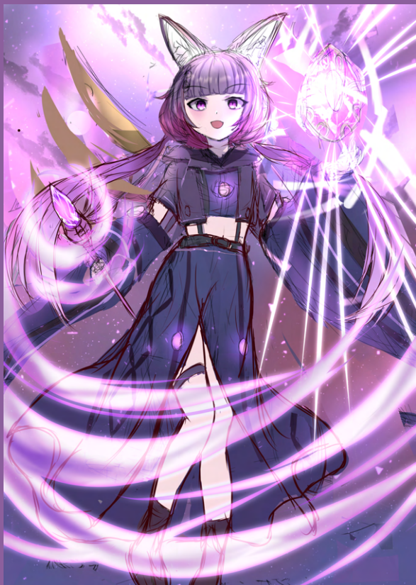
▲ 色ラフ 3、ポーズを変えました。