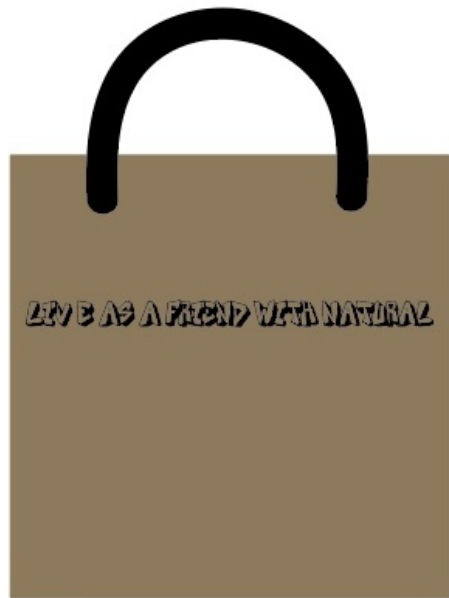
ショッピングバッグ