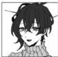
おち 悪瀬 悠

倫理観のズレた気持ちの悪いヤンデレ サディストお兄さん。 幅りがけ虐められている日輪ちゃんを 見て好きになった。