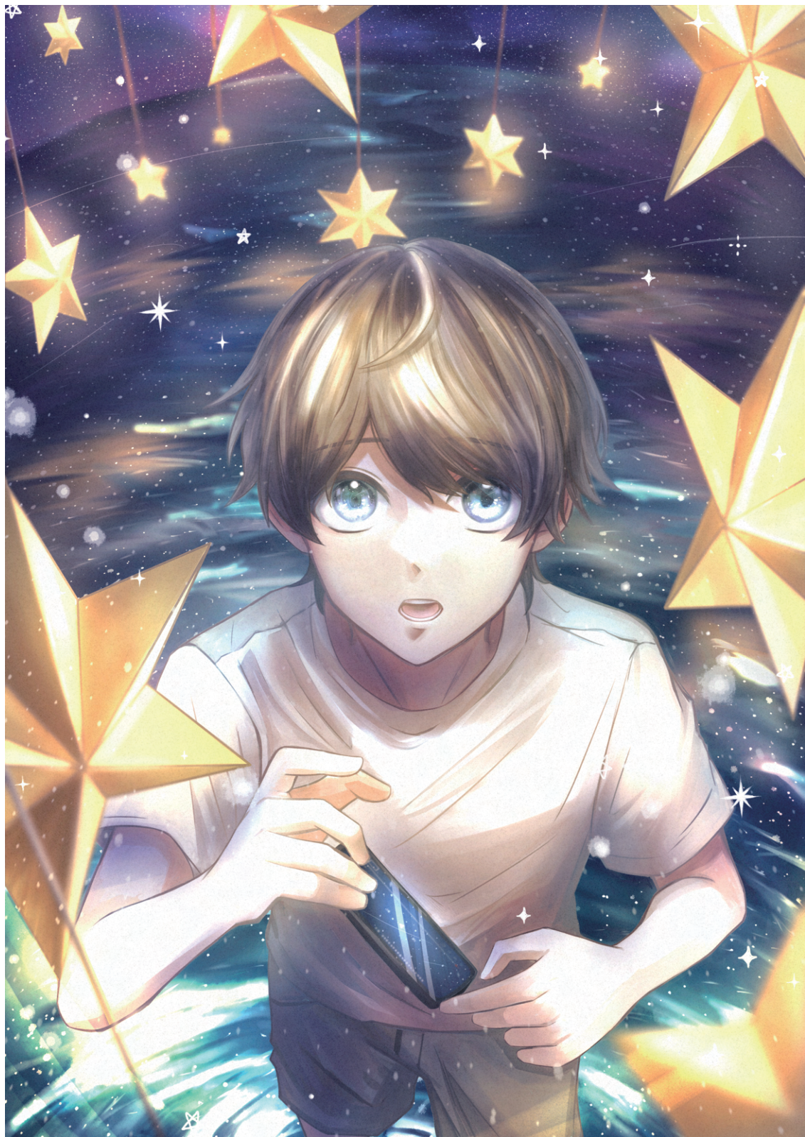
「まだ観ぬ希望の景色」