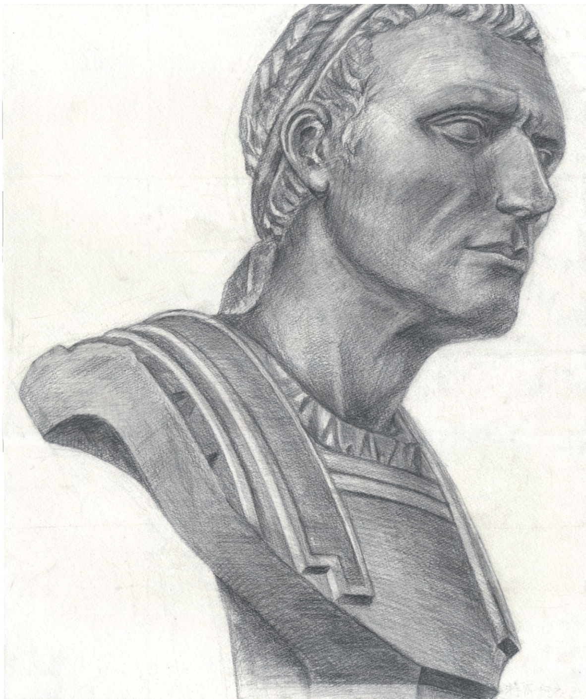
「アンティオコス三世」