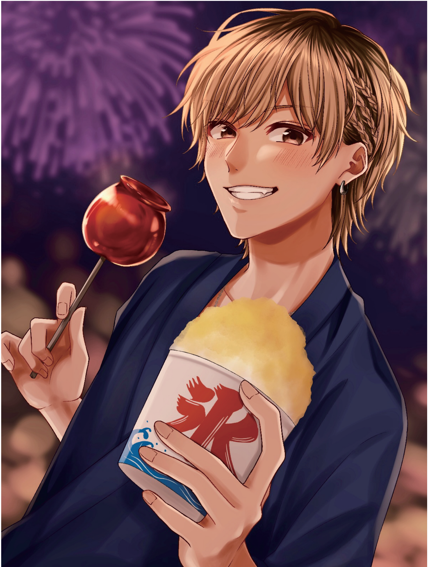
平成のギャル男を描きました。髪の毛の編み込みとりんご飴の質感に力を入れました。