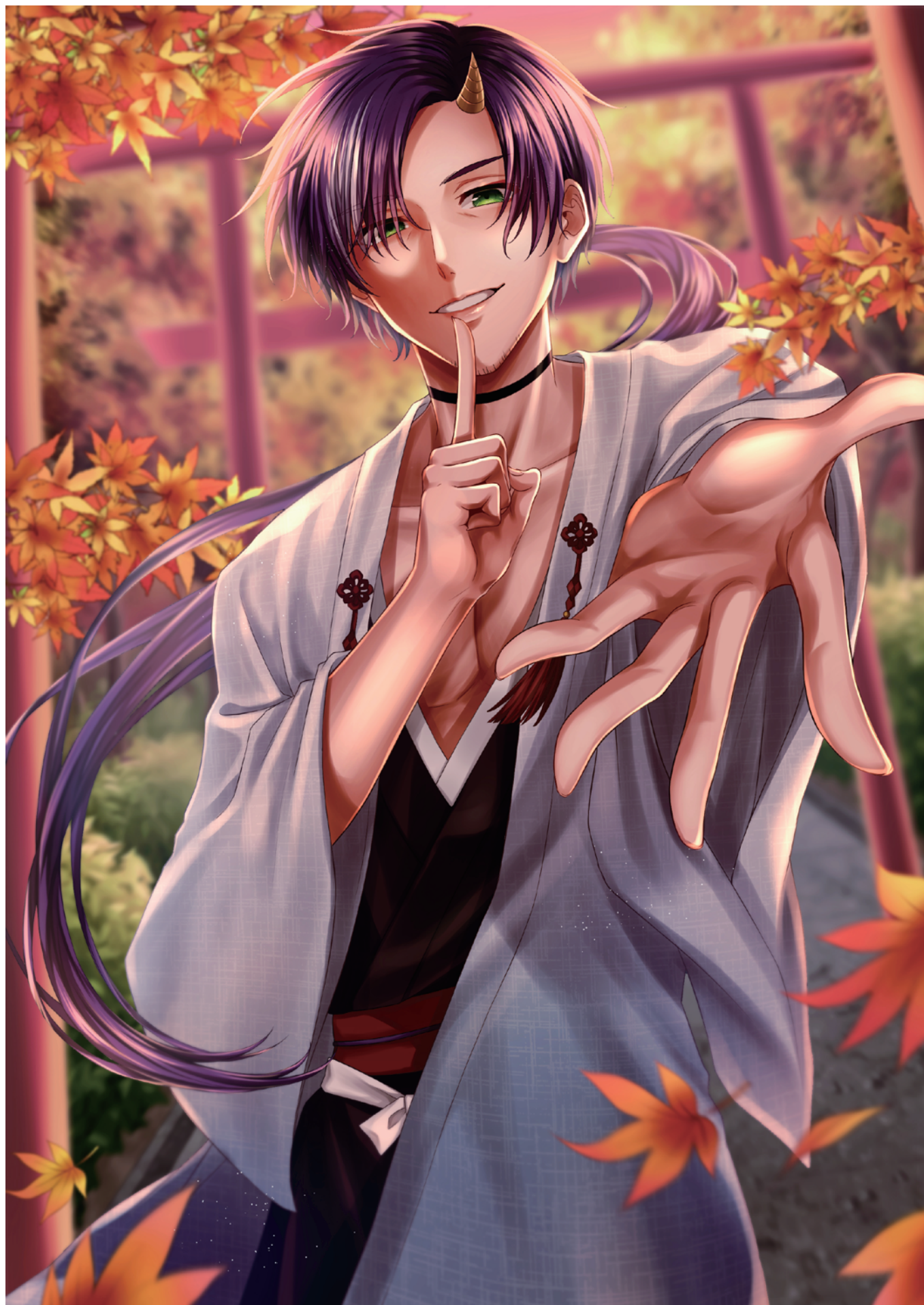
第一回マンガ・イラストコンテストに応募した作品です。秋がテーマです。