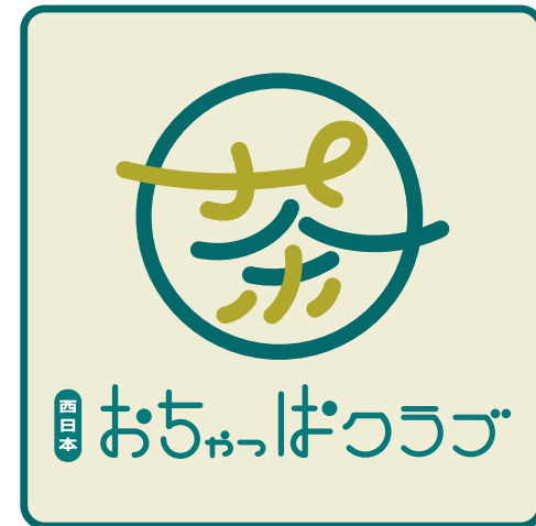
チームステッカー