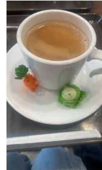
実際に撮影した写真