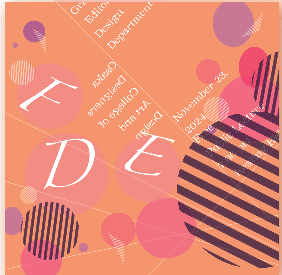
12 | typographics タイポグラフィック/中軸 ( 120×120mm )