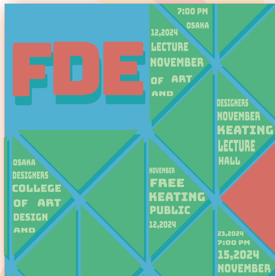
10 | typographics タイポグラフィック/モジュール (120×120mm)