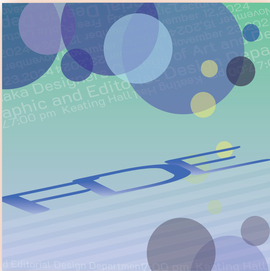
09 | typographics タイポグラフィック/転調 (120×120mm)