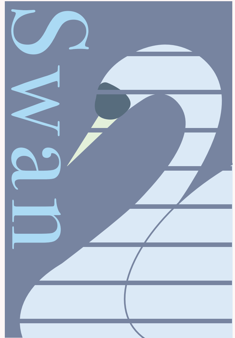
Ai 制作期間：2時間 サイズ：100×148mm