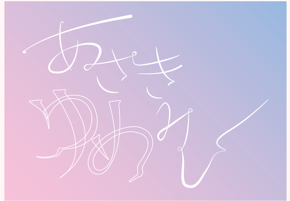
Ai 制作期間：2時間 サイズ：297×210mm