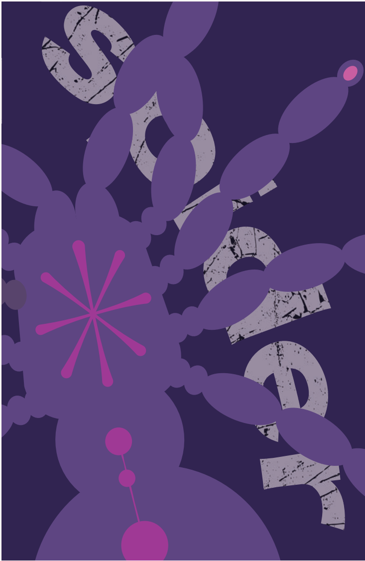
Ai 制作期間：3時間 サイズ：100×148mm