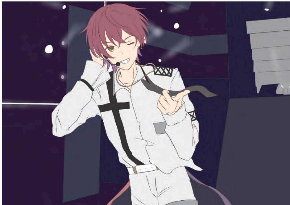
線画 / 下塗り

アイドル育成シミュレーションゲームを想定してかっこいいアイドルのファンサをテーマに制作しました。キャラクターに合う表情を考えて描きました。キャラクターの顔に目が行くよう意識して塗りカッコよくなるように心がけました。