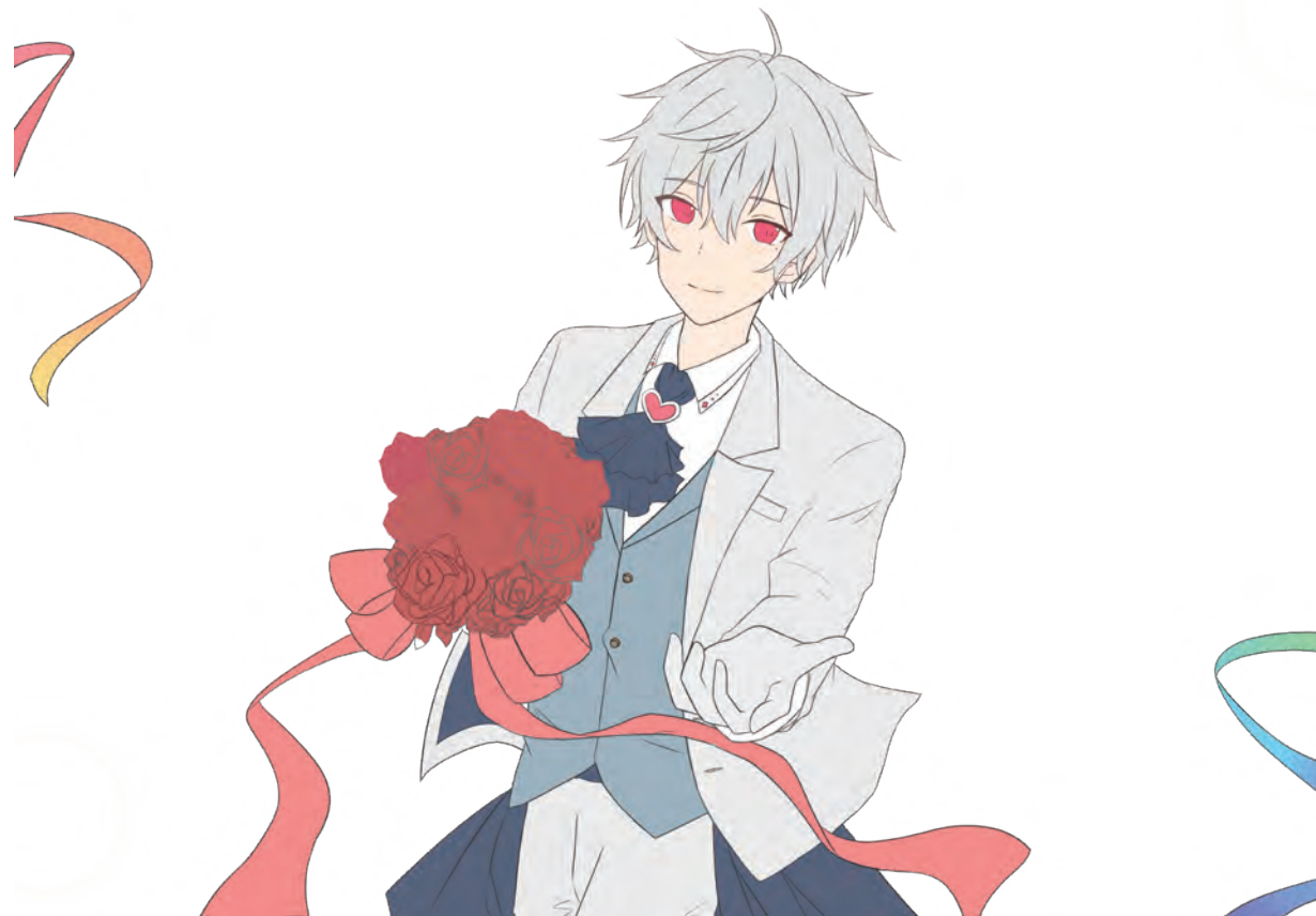
線画 / 下塗り

カラーラフの段階では、背景は室内で考えてましたが背景を依頼した方と話し合い、外のほうが見栄えがいいということで外の階段の背景に決定しました。 衣装は結婚式をテーマにしているので装飾などは少なくしてシンプルにしました。 首元にハートの宝石を付けてキュートさを出しました。