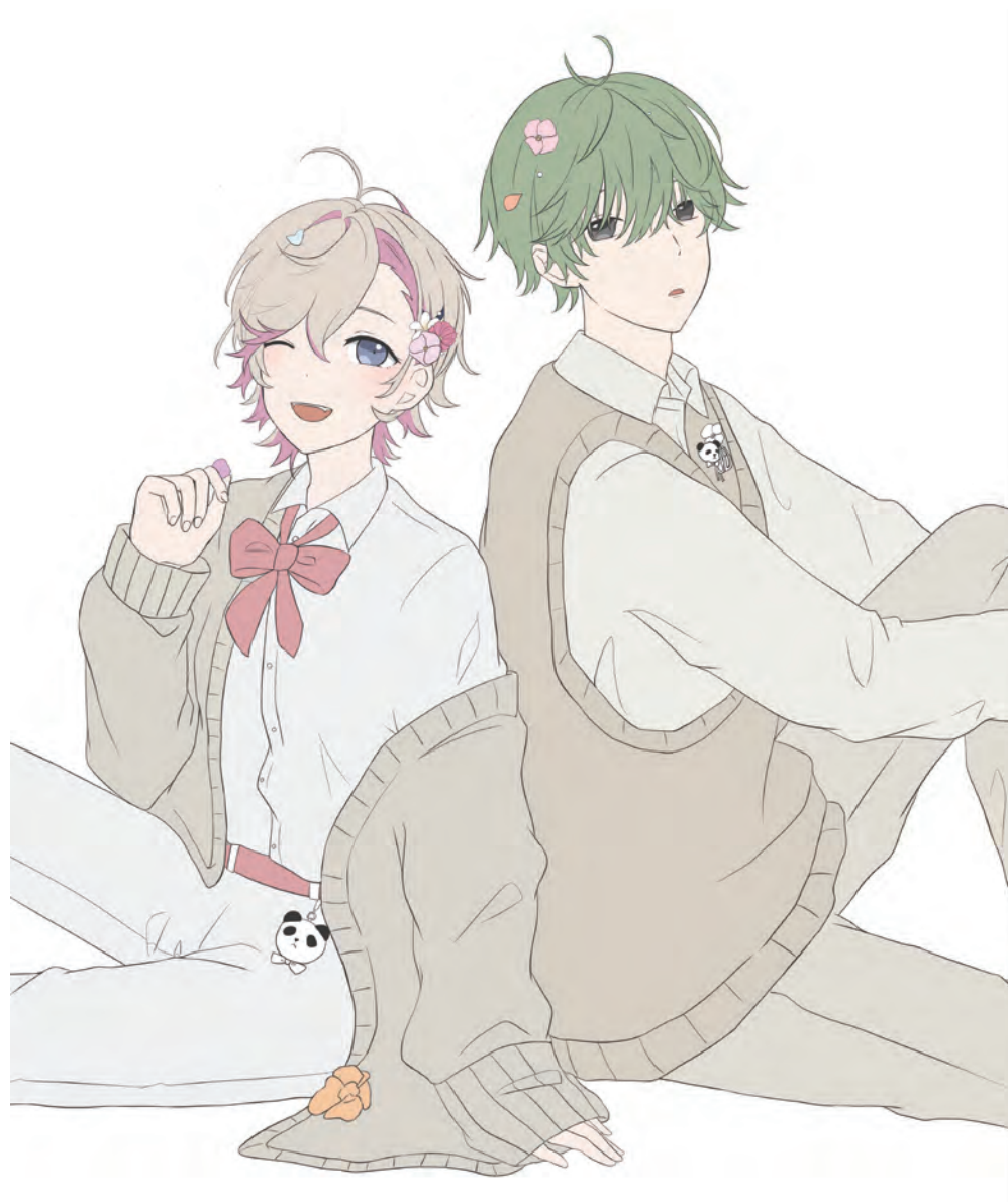
線画 / 下塗り