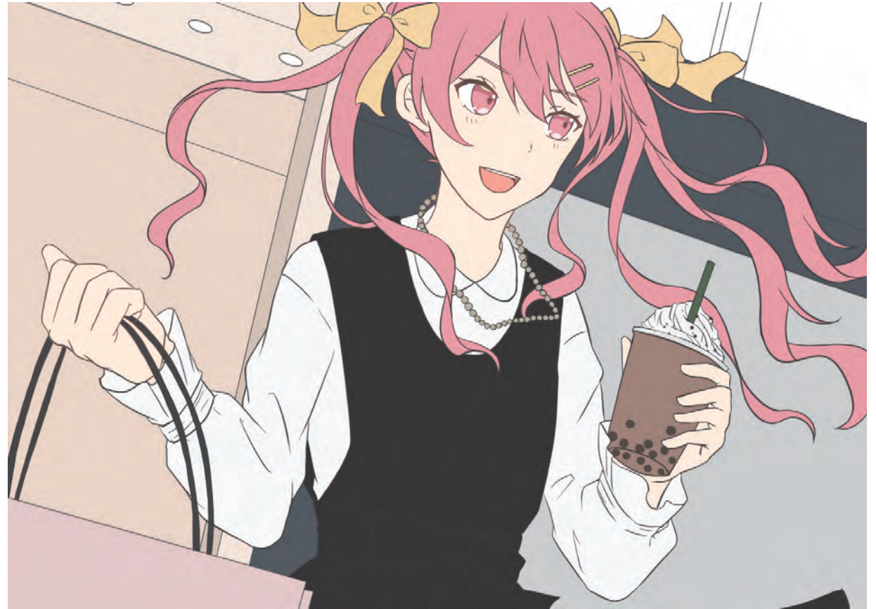
線画 / 下塗り