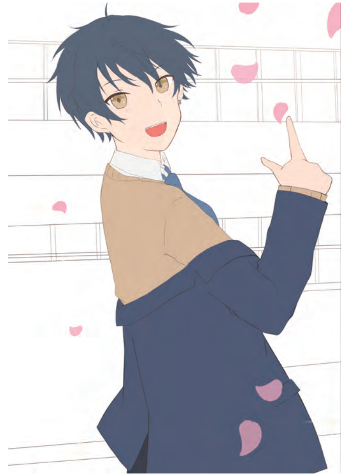
線画 / 下塗り